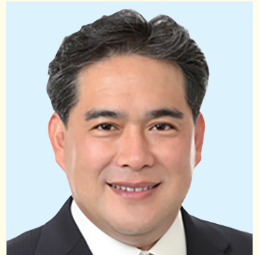
稲沢市議会議員 星野 俊次

「まちづくり」は、市民の皆さんとともに夢を実現していく過程であり、常に新たな課題との挑戦であります。そうした希望や課題に向き合い、「小さくても具体的な一歩」を踏み出す勇氣が必要です。失敗を恐れ問題を先送りするのではなく、市民のみなさんの声に耳を傾け、現場を視て、将来をともに語り合い、